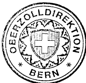
Erich Burkhalter Chef Sektion LSVA 4